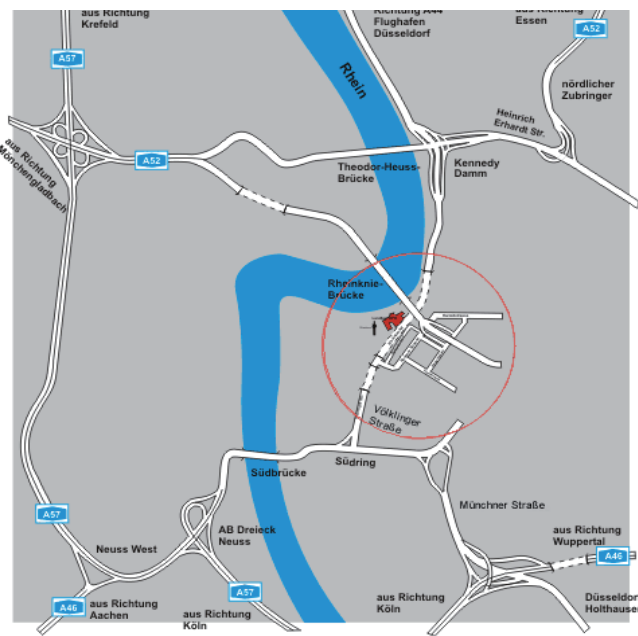
Landtag NRW | SPD-Fraktionssaal, E3D01 | Platz des Landtags 1 | 40221 Düsseldorf |